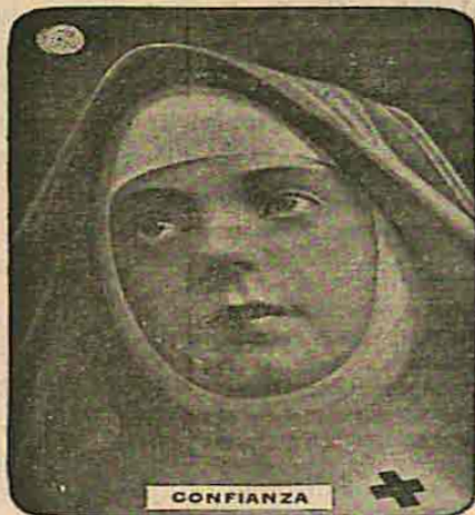
Toda Tableta Genuina Tiene el Monograma AK

En la seguridad y celeridad de su acción se le ha encontrado superior á cualquiera de sus antecesores en